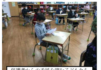
保護者からの手紙を読む子どもたち