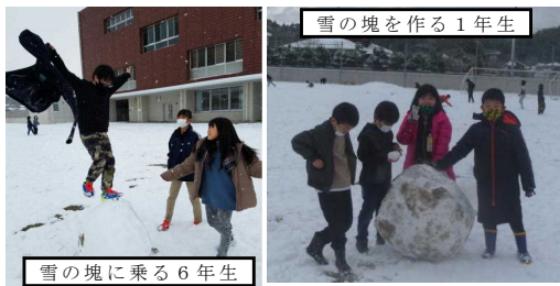
雪の塊を作る1年生

先週の木曜日、今年二回目の大雪で、運動場に約十センチの積雪がありました。雪合戦をしたり、雪だるま(雪の塊?)を作ったりして楽しく遊ぶ姿が見られました。童心に返って一緒に遊んでいる先生もいました。