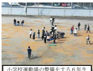
小学校運動場の整備をする6年生

六年生は、出し物のビデオは、各学級で視聴します。今年、コロナ禍もあり、学校の様々な行事が制限されましたが、そのような中でも、六年生は全校児童のリーダーとしての役割をしっかりと担っていました。一年生の世話も機会ある毎にちゃんとやってくれました。先月、小学校の運動場に約六トンの砂を搬入しましたが、六年生全員と体育委員会の児童が、運動場全体に広げてくれました。